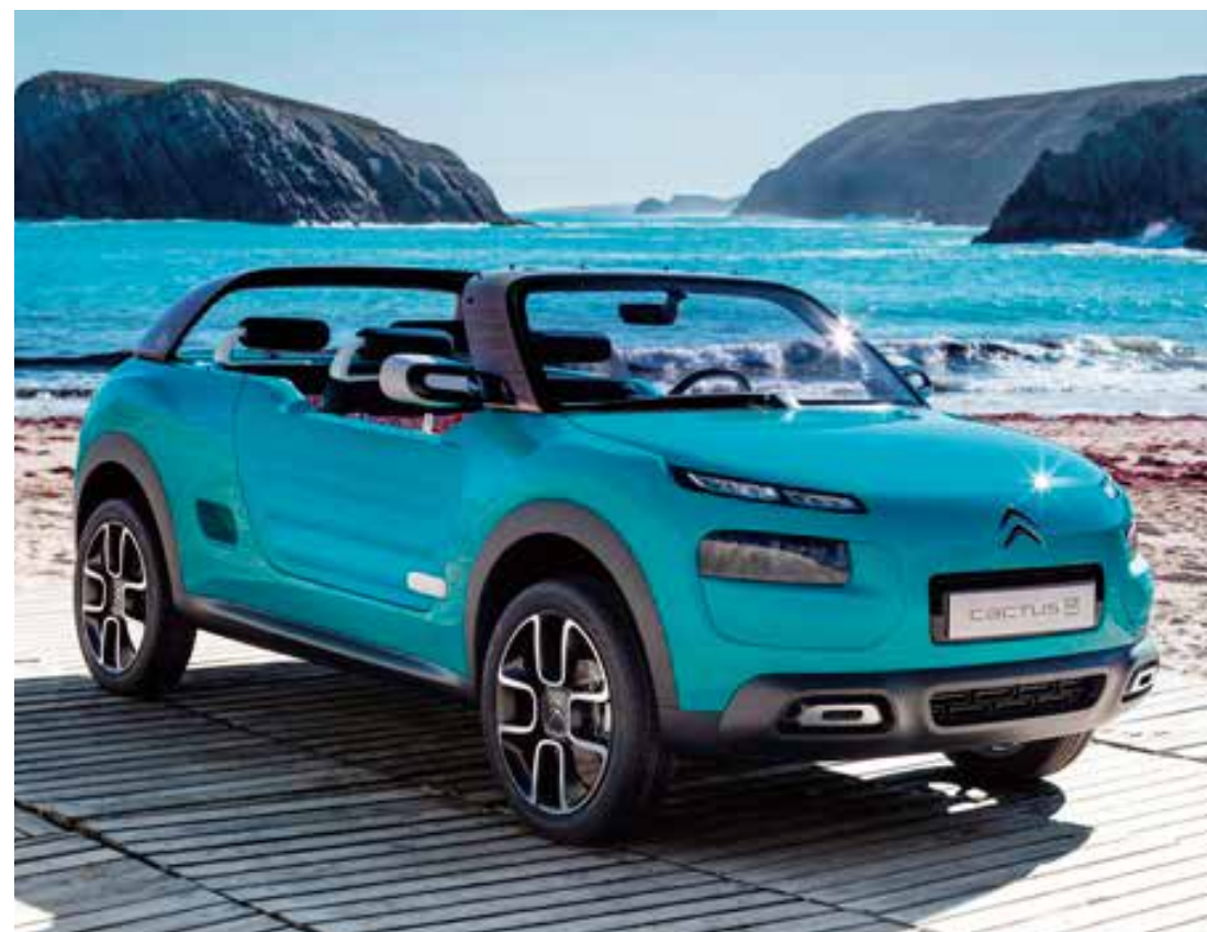
コンセプトカー「CACTUS M」は、シトロエンが掲げる3つのDNAを具現化し、ブランドの未来を表現しています。

In 2014, the approach taken by this concept car came to life when the new GRAND C4 PICASSO made its debut as a commercially available stock car. Adding flair to any street scene, the GRAND C4 PICASSO offers comfort with a functional and futuristic design, and is equipped with cutting-edge technologies. This car is becoming a new symbol of Citroën in Japan as well.