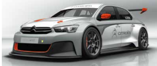
シトロエンC-Elysée WTCC 全長: 4,577mm エンジン: 直列4気筒DOHC+直噴ターボ 全幅: 1,950mm 排気量: 1,598cc、最高出力: 380bhp/6,000rpm ホイールベース: 2,700mm 最大トルク: 400Nm/4,500rpm、車両重量: 1,100kg

Then, in 2014, Citroën Racing once again partnered with Loeb to begin a new challenge, participating in WTCC. This time, he joined with Yvan Muller, the renowned four-time WTCC title winner. Loeb and Muller, who both hail from the same hometown, worked with the team to develop the Citroën C-Elysée WTCC race car. In the first season that Citroën Racing participated they captured both a Manufacturers' title and a Drivers' title. In 2015, as of the 10th rally completed in China, they have earned victories in 17 of 20 races held so far, and have a Manufacturers' title. Now, with two rallies remaining, José-Maria López is also closing in on a Drivers' title. Muller and Loeb are at second and third places, respectively, in what is becoming a magnificent competition to seize the top spot for the title.