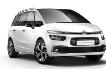
グランド C4スペースツアラー オリジンズ