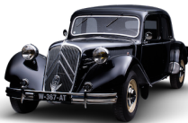
トラクシオンアヴァン

追記：歴代モデル13台の展示は21日（土）22日（日）の両日に関しては「ヒルズマルシェ」および「赤坂蚤の市 in ARK HILLS」開催のためお休みとなり、23日（月・祝）はパレードラン到着予定の10時30分以降となります。なお、グッズ販売、バーンファインドカーの展示などは期間中を通してお楽しみいただけます。