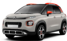
C3 エアクロス SUV

シトロエン100周年記念モデルの「C3オリジンズ」「グランドC4スペースツアラーオリジンズ」を含めた現行モデルを展示いたします。また会場を起点に現行モデル（C3 セントジェームス、C3 エアクロス SUV、C5 エアクロス SUVの3台）の試乗もお楽しみいただけます。試乗は21日（土）、22日（日）、23日（月・祝）の祝休日の3日間限定で、10時～17時となります。試乗お申し込みは当日の9時30分～16時まで、試乗時間は15分程度となります。